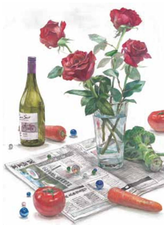
参考作品 静物着彩