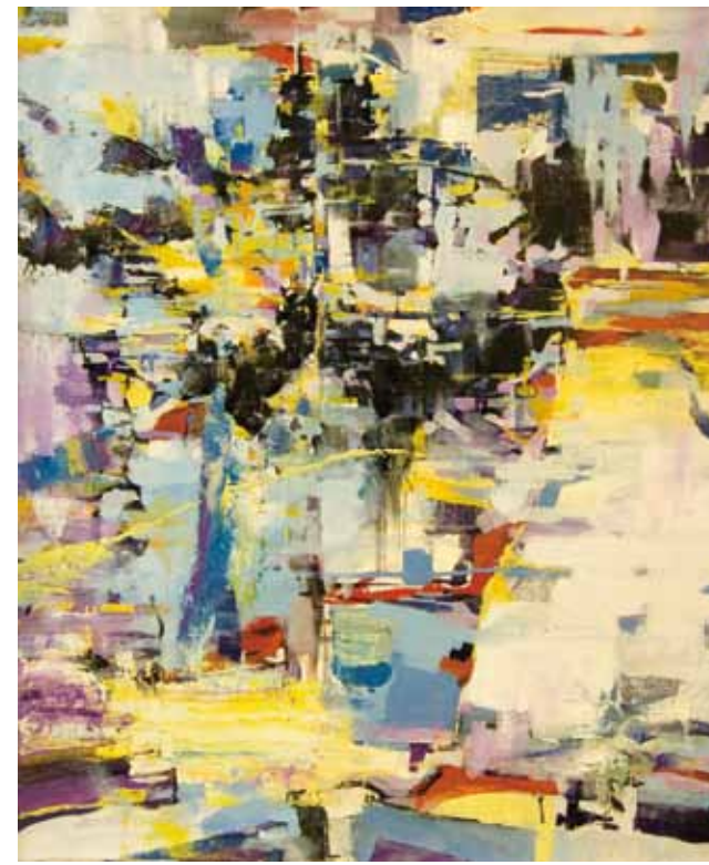
参考作品 絵画表現

*A期では、学校の都合により受講が難しい現役生は日割の受講も可能です。各校事務局にお問い合わせください。