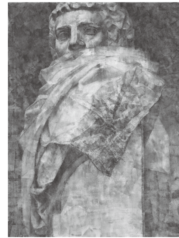
参考作品 静物デッサン

東京藝術大学絵画科油画専攻、武蔵野美術大学絵画科油画専攻・版画専攻、多摩美術大学絵画科油画専攻・版画専攻等を志望する学生のためのコースです。全期を通じて基礎力の充実と自己表現の模索を目標とした内容となっています。多様な課題を通じ、自分自身とじっくり向き合います。講習会最後の3校合同コンクールでは、入試ながらの実技審査が行われます。揺るぎない表現の土台を築き、自信を持って受験に臨む体制を整えましょう。