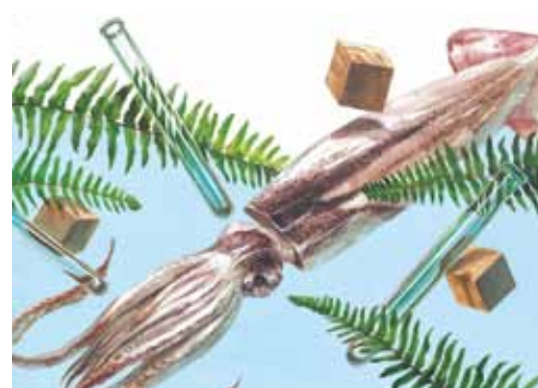
参考作品 上・静物デッサン 下・平面構成

東京藝術大学に設置されているデザイン科・工芸科を志望する学生のためのコースです。デッサンを中心に基礎を確実に身につけ、本人の持つ感性をさらに伸ばしていきます。講習会の最後には、3校合同コンクールを行います。いつもとは違う緊張感の中、講習会で身につけた実力を試みましょう。