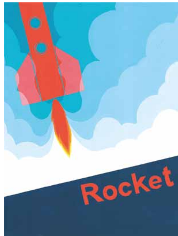
参考作品 色面構成

*A期では、学校の都合により受講が難しい現役生は日割の受講も可能です。各校事務局にお問い合わせください。