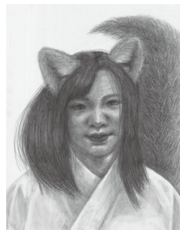
参考作品 自画像デッサン

東京藝術大学先端芸術表現科や武蔵野美術大学映像学科、京都精華大学マンガ学科等の映像に関する学科やアニメ・マンガに関する学科を志望する学生のためのコースです。基本的なデッサン対策から、映像科試験で多く出題されるイメージデッサン課題等を中心に取り組んでいきます。