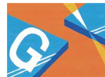
千葉大工学部デザイン学科 合格再現作品 色彩構成