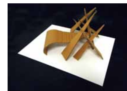
千葉大工学部デザイン学科 合格再現作品 立体構成