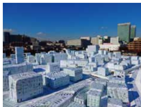
参考作品 自主テーマ作品