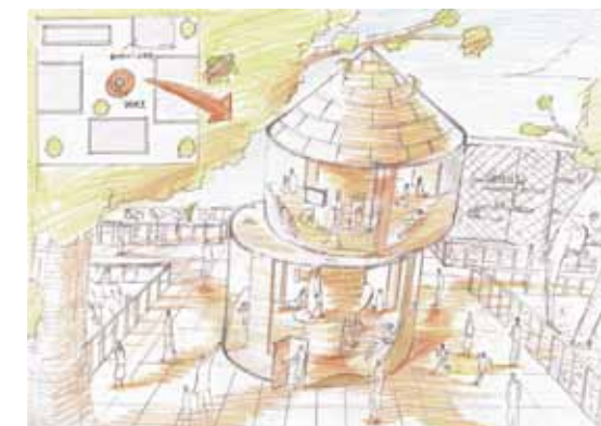
筑波大学 芸術学群環境デザイン領域 合格再現作品