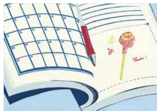
右:金沢美術工芸大学・視覚デザイン科合格再現作品 平面構成 左:参考作品 構成デッサン